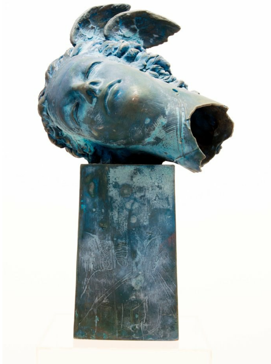
Rzeźba Igora Mitoraja "Dea Ferita", 2005r, z galerii Contini Art