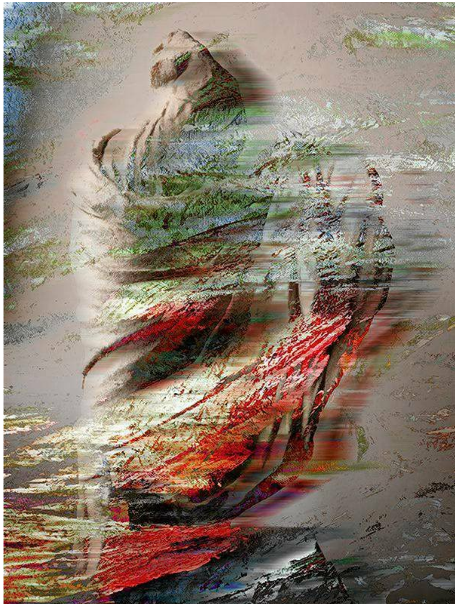
Praca Fu Wenjuna "Gone with the Wind"