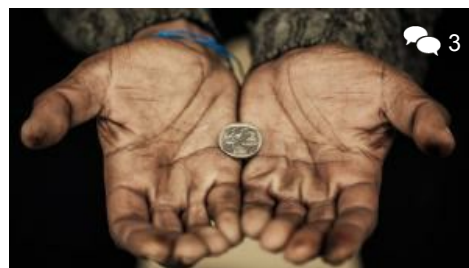
Różne oblicza ubóstwa w Polsce