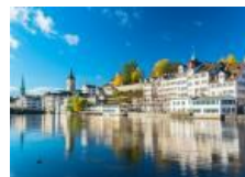
5 najdroższych miast na świecie. Gdzie życie kosztuje fortunę?