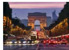
Kraje, w których religia nic nie znaczy dla obywateli